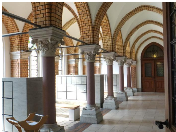
Kolumbarium im Ostflügel der Kapelle